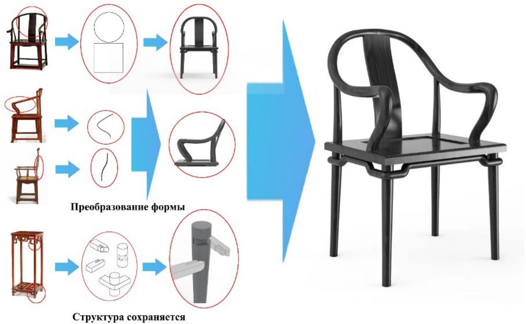
Рис. 2. Проект 2. Трансформация формы и структуры стула с эргономичной S-образной спинкой